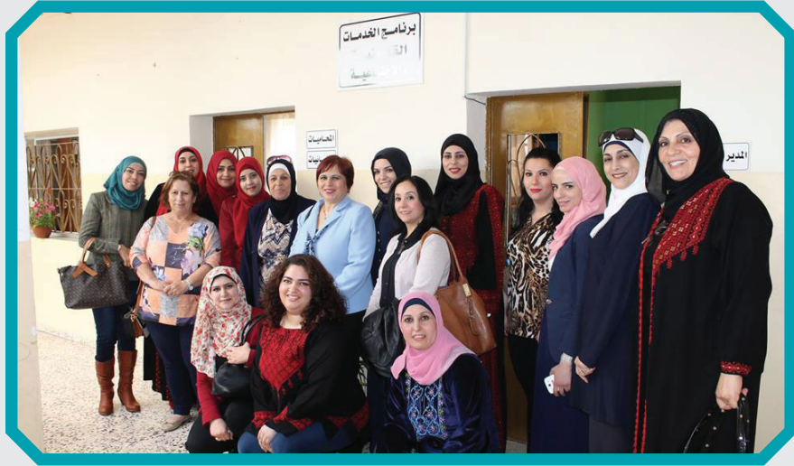
افتتاح قسم الخدمات في جمعية سيدات اريحا