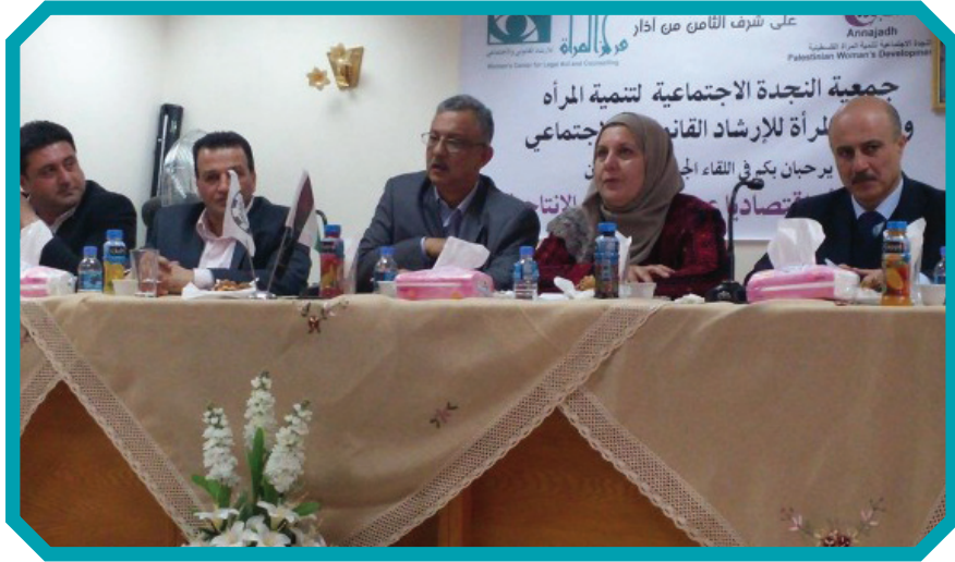
الثامن من أذار جمعية النجدة ٢٠١٦

والاجتماعات مع المؤسسات المختلفة المعنية وزيارات ميدانية للاطلاع على واقع العنف ضد المرأة ومن بينها زيارة البلدة القديمة في مدينة الخليل، ولقاء عدد من النساء والفتيات للاستماع منهن لواقع العنف والانتهاكات التي يتعرضن لها، وخاصة عنف الاحتلال والمستوطنين واختتمت جولتها في الأراضي الفلسطينية بزيارة قطاع غزة.