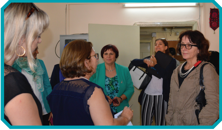
زيارة المقررة الخاصة للعنف ضد المرأة الى البيت الآمن

النزاع والشقاق بلغ عددها ١٠٢ دعوى منها ما هو مرفوعة من قبل الزوج وما هو من قبل الزوجة وقد ارتفعت نسبة رفع هذه الدعاوى بعد صدور التعميم الذي بدأ تطبيقه من ٢٠١٢/٩/١ ارتفاعا ملحوظا، حيث أن التعميم قد سهل من اجراءات الدعوى وأصبح بإمكان الزوج ايضا الاستفادة من هذه التسهيلات كما افادت جميع المحاميات و اجمعن على ذلك، وهذه نسب متقاربه من حيث توجه الأزواج لرفع هذه القضايا للتخلص من حقوق الزوجات او التخفيف منها خاصة ان فرصته على اثبات الدعوى اقوى من فرصة النساء من حيث احضار البينة الشخصية و توكيل محام ودفع اتعاب له .