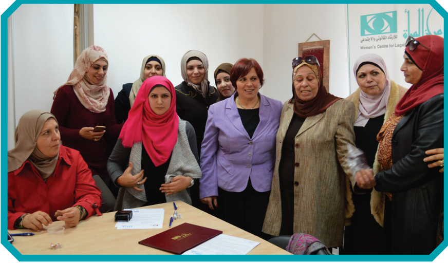
توقيع مذكرة تفاهم مع مؤسسات قاعدية

استقبلت مكتبة المركز في رام الله خلال العام ٢٠١٦ ما يقارب (٢٠٠) زائر ومستفيدا من الطلبة، باحثين، محامين، مدربين، نشطاء في مجال حقوق المرأة الراغبين في الاطلاع على الكتب والمراجع المتوفرة حول قضايا المرأة المختلفة، في حين استقبلت مكتبة فرع الخليل ما يقارب (٣٠) زائرا.