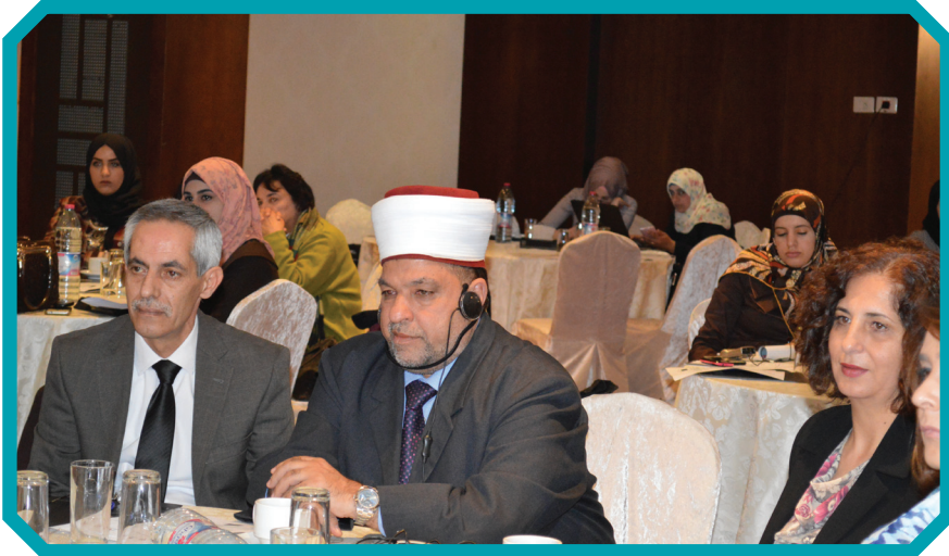
مؤتمر حق المرأة في الميراث