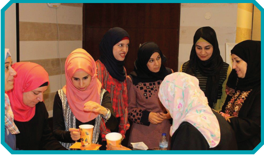
تدريب مهارات التيسير والاتصال المجتمعي

وضعية حقوق المرأة الفلسطينية تحت الاحتلال. اضافة الى مقابلة عدد من الوفود المشاركة والممولين الامر الذي فتح افاقا للمركز لعقد شراكات جديدة. وخلال أيار ٢٠١٦، قدم المركز بيان مكتوب وشفهي للجنة الأمم المتحدة الخاصة للتحقيق في الممارسات الإسرائيلية والتي تؤثر على حقوق الإنسان للشعب الفلسطيني في الأراضي المحتلة، وأبرزت آثار انتهاكات حقوق الإنسان الإسرائيلية على النساء الفلسطينيات اللواتي يعشن تحت الاحتلال الإسرائيلي. كما وقدم للجنة ملفا يتضمن ملخصا لانتهاكات حقوق الإنسان التي وثقتها المركز عام ٢٠١٥.