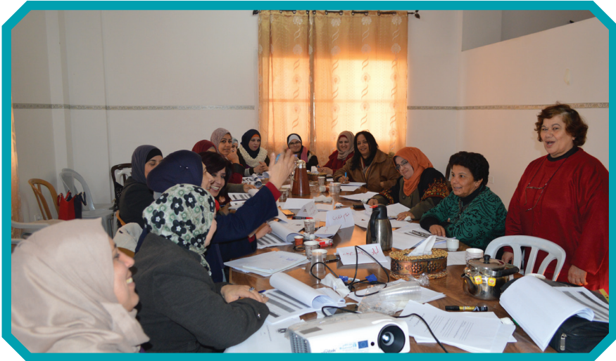
تدريب كوادر الاتحاد العام للمرأة الفلسطينية حول القرار (١٣٢٥)

وأبرز المركز في تقريره عدد من التوصيات التي يجب الاهتمام بها وهي: