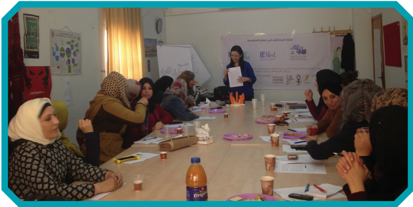
دورة توعية الخليل

تميز التدريب بمشاركة منفتحة وناضجة نفسياً، رغم تفاوت الخبرات والمهارات، للمشاركة اللواتي أنشأن من خلال حضورهن المتفهم والداعم لبعضهن البعض ومعرفتهن واستعدادهن للتعلم مكاناً إنسانياً ومهنياً اتسع لتداول معضلات مهنية وقيمية شخصية هامة لنقاشات مهنية ولتعميق استبصارات ذات أثر في نفوسهن وهوياتهن المهنية. وساهم في توضيح الخطى للعمل على تقديم خدمات الارشاد القانوني والاجتماعي من خلال