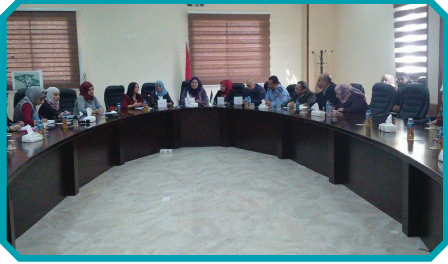
مناهضة العنف ٢٠١٦ جمعية النجدة

في الشرطة حول استغلال النساء والاساءة لهن من خلال الاستخدام الغير واعى او الخاطى لوسائل التواصل الاجتماعي، واختتمت هذه اللقاءات بورشة عمل شارك بها ٦١ شخص من المؤسسات الاهلية والرسمية والناشطات المجتمعيات، وتم خلالها استضافة المحافظ ووحدة حماية الاسرة في الشرطة ووزارة الاوقاف، تم خلال الورشة عرض مداخلات من الجهات المدعوة وجمعية طوباس ركزت المداخلات على طبيعة القضايا التي وصلت الشرطة ضمن الجرائم الالكترونية وربطت مداخله الاوقاف بين زيادة احصائيات الطلاق في محافظة طوباس والاستخدام الغير واعى لمواقع التواصل الاجتماعي، وكيف تساهم أحيانا استغلال النساء من خلال هذه المواقع لابتزازهن وتشكيل مخاطر اسرية، وخرج المشاركين بتوصيات حول ضرورة التوعية من خلال المساجد، والمراكز الشبابية والاسرية، ونتج عن اللقاء تنسيق مع وزارة الاوقاف لتدريب أئمة المساجد للحديث حول مشاكل مواقع التواصل الاجتماعي وطرحه بطريقة تحمي النساء وتساعد في الوقاية من الاضرار اللاحقة للاستخدام الخاطى او الغير واعى.