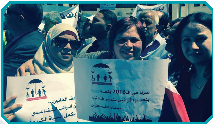
في مسيرة الاحتجاج على قانون الضمان الاجتماعي

احيا مركز المرأة والمؤسسات النسوية القاعدية الذكرى السنوية ليوم المرأة العالمي في الثامن من آذار من خلال سلسلة فعاليات وانشطة في المحافظات المختلفة. في محافظة اريحا نظم المركز بالشراكة مع جمعية سيدات اريحا الخيرية ورشة عمل حول «التمكين الاقتصادي للنساء ودورهن في التنمية». وشارك فيها ممثلين عن وزارة العمل ومؤسسة فادن الفلسطينية للإقراض والتنمية، والعديد من المؤسسات الحكومية والاهلية بحضور (٤٠) مشاركا ومشاركة أكدوا على أهمية تمكين النساء اقتصاديا في المحافظة وتشبيكهن مع المؤسسات ذات العلاقة. جرى التأكيد خلال الورشة أهمية دور الجمعيات التعاونية النسوية في تمكين المرأة اقتصاديا من خلال ايجاد فرص عمل وتسويق منتجات الجمعيات. كما عرضت خطة متكاملة حول برنامج الخدمات القانونية والاجتماعية المخطط تنفيذها في محافظة اريحا بالشراكة بين المركز والجمعية والتي تتركز حول تمكين وتطوير قدرات طاقم جمعية سيدات اريحا المختص ورفدهم بخبرة وتجربة المركز في هذا المجال، وتوفير الدعم والاسناد للجمعية في عقد حلقات وورش التوعية للمجتمع المحلي من خلال استحداث برنامج خدمات وعيادة قانونية اجتماعية متخصصة في المحافظة تساهم في توسيع نطاق الخدمات القانونية والاجتماعية المقدمة للنساء في المناطق المهمشة.