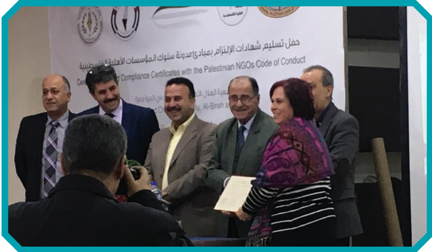
تسلم شهاد التميز

اما في محافظة طولكرم فقد نفذت سلسلة من ورشات التوعية بمواضيع العنف القائم على اساس النوع الاجتماعي، والجرائم الالكترونية، في مخيم نور شمس، ومخيم طولكرم، وفي قرية بيت ليد، وفي جامعة القدس المفتوح وخضوري، وكان هناك تفاعل كبير من قبل الفئة المستهدفة في هذه اللقاءات حيث سبقها التنسيق مع مؤسسات المجتمع المدني في مخيم طولكرم، بيت ليد، ومخيم نور شمس، والشرطة (وحدة الجرائم الالكترونية)، التوجيه