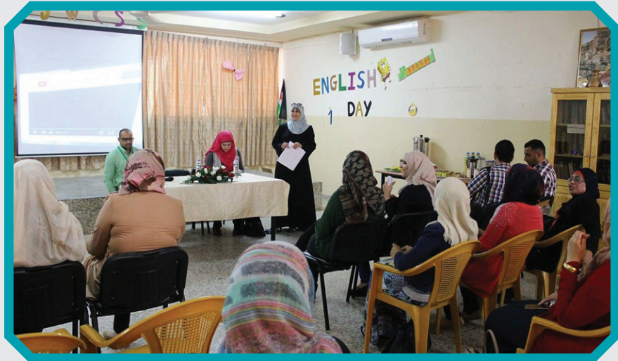
الثامن من اذار ٢٠١٦ جمعية سيدات اريحا