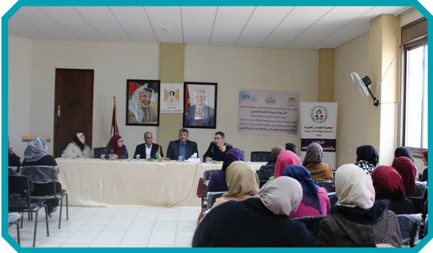
مناهضة العنف ٢٠١٦ جمعية طوباس

جمعية طوباس نظمت سلسلة لقاءات توعية بالتعاون مع وحدة حماية الأسرة